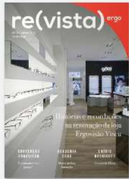
REVISTA ERGO 8 há 2 anos