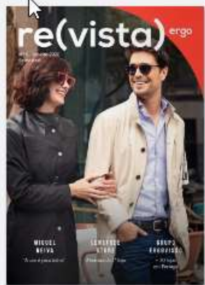
REVISTA ERGO 6 há 2 anos