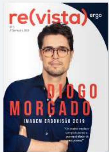
REVISTA ERGO 5 há 2 anos