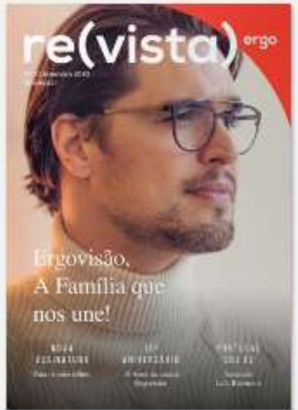
REVISTA ERGO 7 há 2 anos