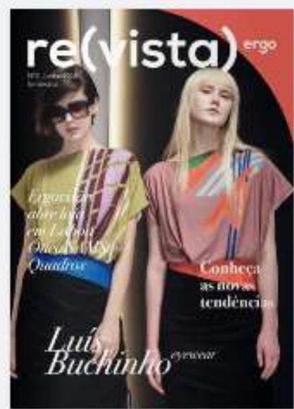
REVISTA ERGO 4 há 2 anos