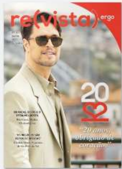
REVISTA ERGO 10 há 6 meses