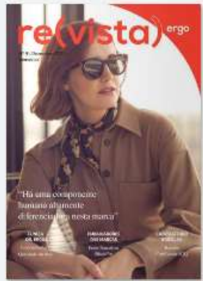
REVISTA ERGO 9 há um ano