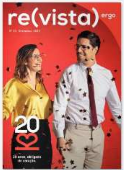
REVISTA ERGO 11 há 10 dias